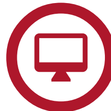
Dostęp do Blackline Live