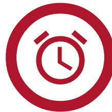
Cykliczne zgłoszenia "check-in"