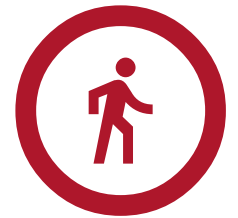
Akcesoria do noszenia